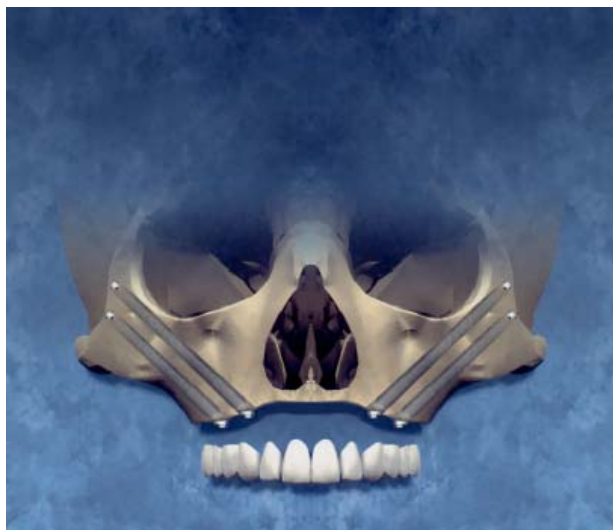
Figura 1 Esquema proposto de tratamento 5 .

severa em relação ao seio maxilar ou aos tecidos moles foi relatada (Figura 1).